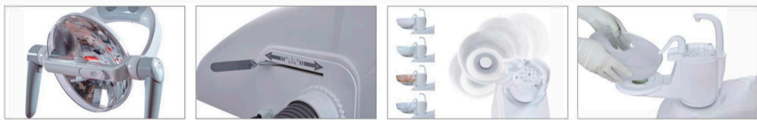
Lámpara LED con sensor reflectivo con color de temperatura ajustable