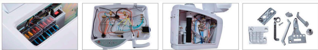
Plug-in fuse, Aluminum